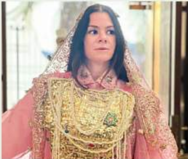
Aloula hosts fundraiser to give back to society