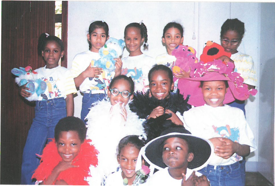
لحظة مرح مع البنات