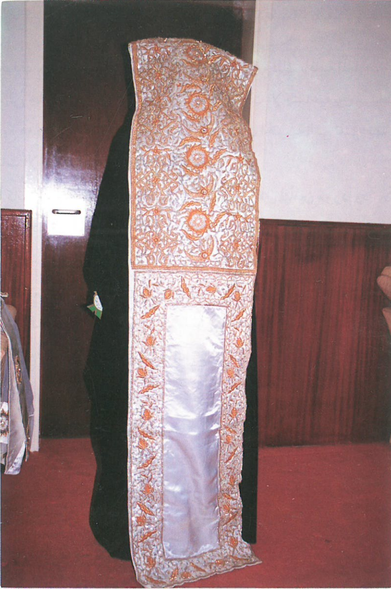
من الملابس التراثية