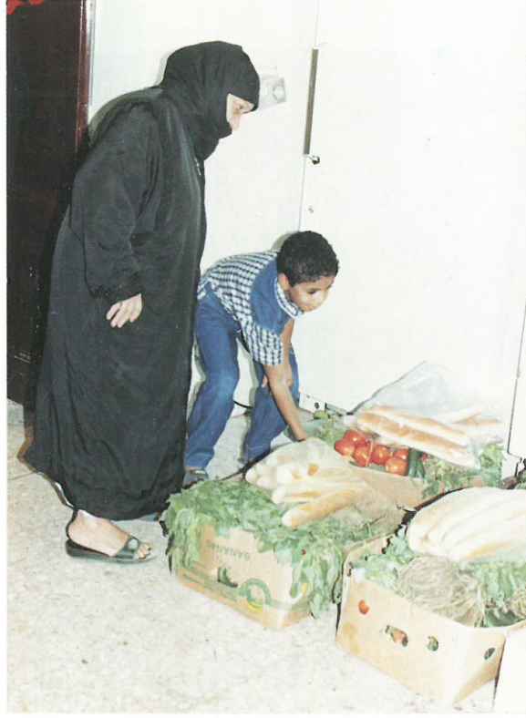
بعض الأسر خلال إستلام المساعدات العينية