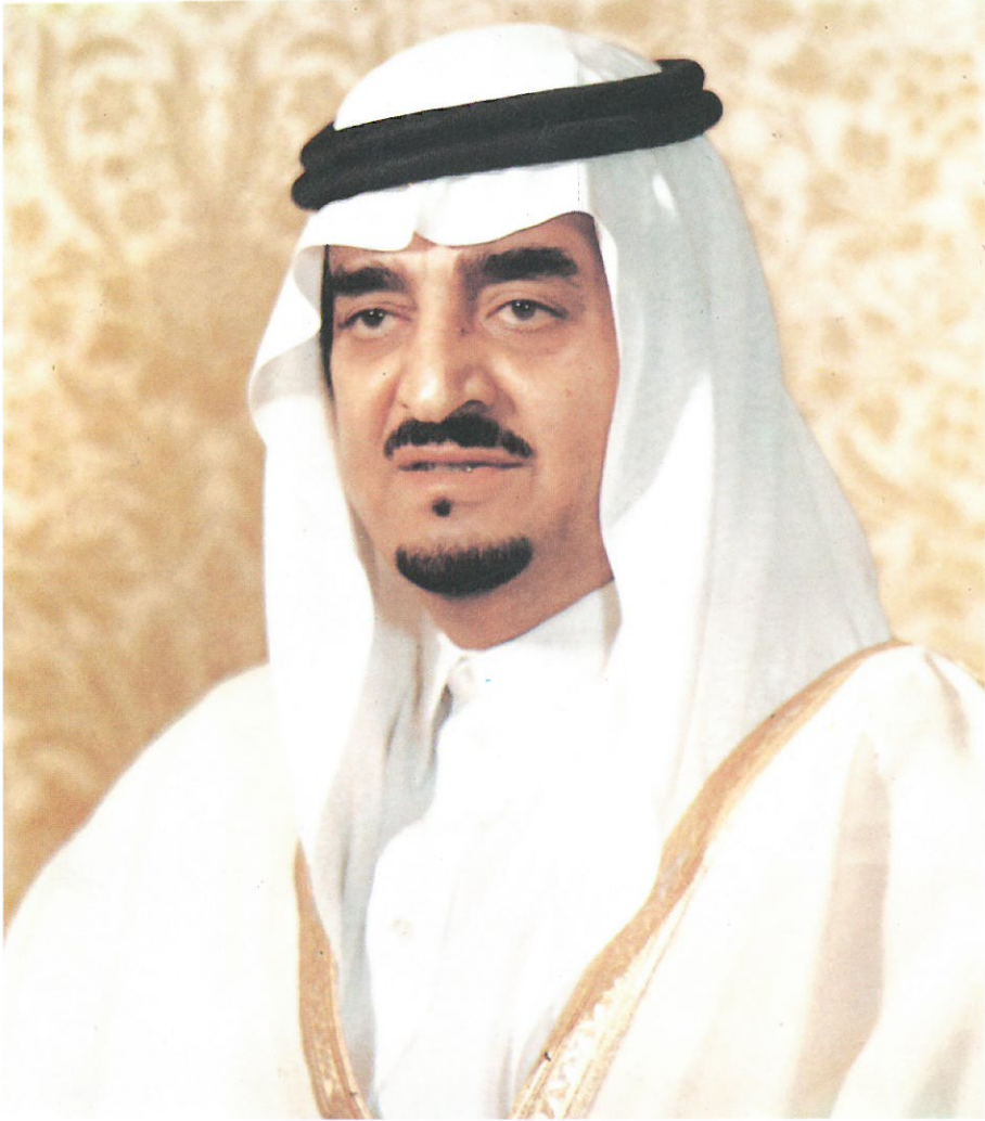
خَادِمُ الْحَرَمَيْنِ الشَّرِيفَيْنِ الْمَلِكِ فَهْدِ بْنِ عَبْدِ الْعَزِيزِ آلِ سَعُودٍ