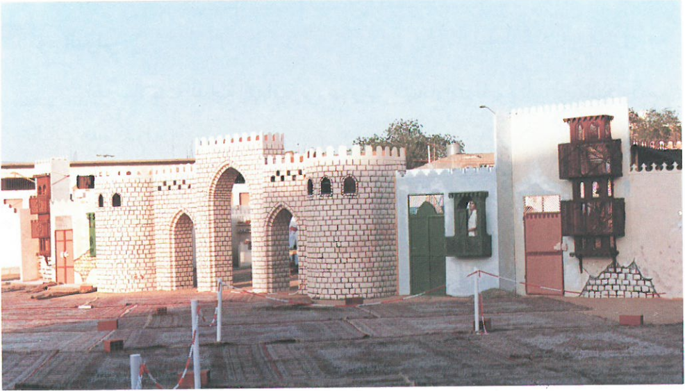
لقطات من تراثنا القديم