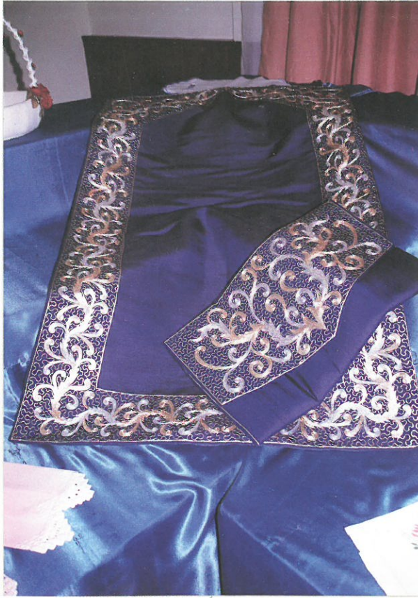
سجادة صلاة مطرزة من إنتاج المشغل