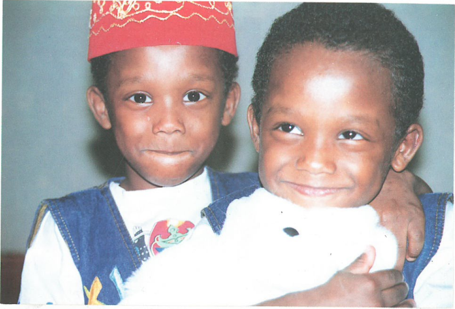
صداقة في الحضانه