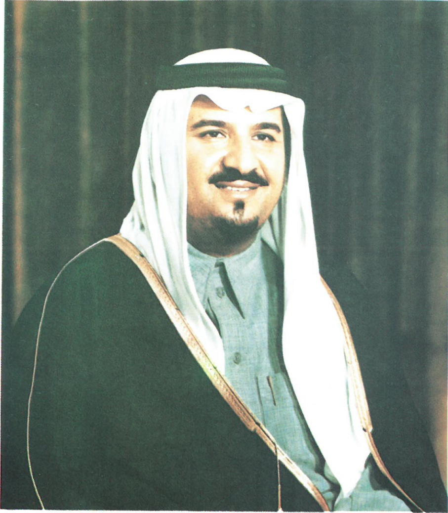
صَاحِبُ السُّمُو الْمَلَكِيِّ اللَّهِيرِ سُلْطَانِ بْنِ عَبْدِ الْعَزِيزِ الرَّسُولِيِّ النَّائِبِ السَّامِيِّ لِرَأْسِ مَجْلِسِ الوَزَرَاءِ وَوَزِيرِ الدِّفَاعِ وَالطَّيْرَانِ وَالْمَفْتَى الْعَامِ