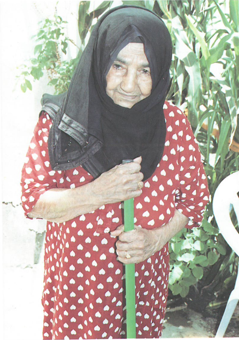
عجائز من قاطنات الأربطة والمبرات الخيرية القابعة لإشراف الجمعية