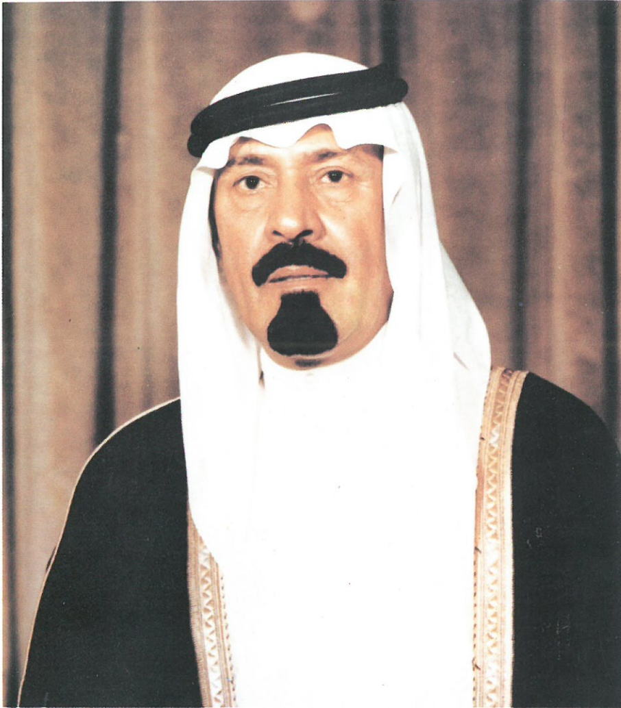
صَاحِبُ السُّمُو الْمَلَكِيِّ لِلْمُؤَدَّبِ عَبْدِ اللَّهِ بْنِ عَبْدِ الْعَزِيزِ بْنِ عَبْدِ الرَّحْمَنِ وَلِيَّ الْعَرْشِ وَنَائِبُ رَئِيسِ مَجْلِسِ الْمَوْزَأِ وَرَئِيسِ الْحَرَسِ الْوَطَنِ